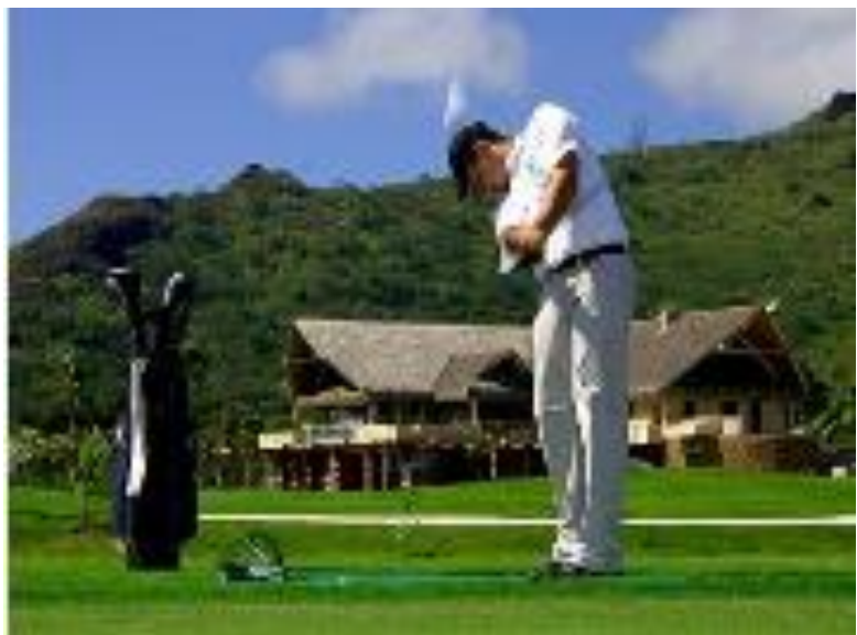
Moorea Green Pearl Golf Course Polynesia

Øgruppen Guadeloupe : http://www.youtube.com/watch?v=3di4wRjzy