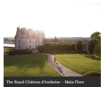
The Royal Château d'Amboise – Maia Flore