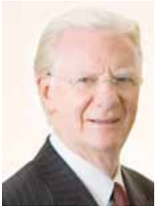
Bob Proctor, USA (deltager via telecall)

Bob Proctor er på verdensplan anerkendt som "the master thinker", og har bl.a. medvirket i den verdensomspændende bog og film "The Secret". I 50 år har han været med til at forbedre menneskers liv ud fra hans enorme indsigt og viden om sindet. Han er forfatter til bestsellerbogen "You were born Rich", har gæstet Larry King og Ellen DeGeneres talkshows, og afholdt seminarer, kurser og uddannelser for millioner af mennesker rundt omkring i verden. På denne lederuddannelse vil han bidrage med sin store viden om sindet. Hvordan vi selv er årsagen til de resultater, vi skaber. Hvordan vi kan forbedre disse resultater ved at være indre styret frem for ydre styret, og hvad der egentlig menes hermed.