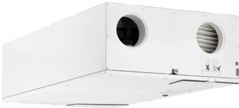
HCC 2 boligventilationsaggregat

På Building Green den 29.-30. oktober i Forum, præsenterer Dantherm et nyt boligventilationsaggregat, HCC 2, en særdeles konkurrencedygtig ventilationsløsning i forbindelse med nybyggeri og ved renovering af boligblokke og etagebyggeri.