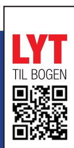
Eksempel på en DigiLire-bog og lyd.