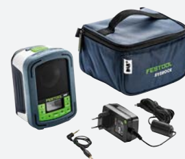
Batteri og oplader fra side 22.