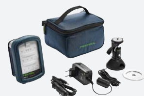
Batteri og oplader fra side 22.