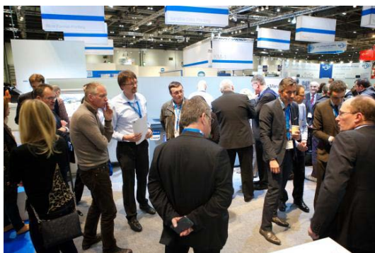
Konica Minoltas stand – den største på IPEX 2014 – viste hvordan produktionsprint kan være en forretningsmulighed for industrien

Konica Minolta Business Solutions Denmark a/s er en central udbyder af dokumenthåndteringsløsninger i Danmark. Virksomheden beskæftiger sig primært med salg, service og support af løsninger inden for workflow, ECM, print, kopi og digitale produkter. I Danmark har Konica Minolta 230 medarbejdere. Konica Minolta Business Solutions Denmark a/s er 100 % ejet af Konica Minolta Business Solutions Europe GmbH og er en del af en international koncern, der på verdensplan beskæftiger over 35.000 medarbejdere. Alle andre mærke- og produktnavne kan være registrerede varemærker eller varemærker tilhørende deres respektive ejere og anerkendes hermed.