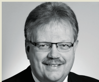
Mogens Gade, Borgmester