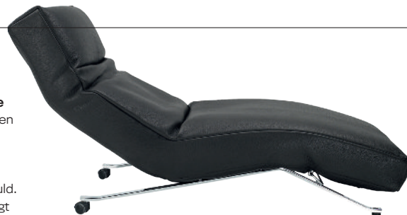
* Hvilestolen Control Glove Eilersen har doneret en lækker Control Glove-hvilestol. Den er formet af fire uafhængige sektioner, hvilket giver stolen en ekstra smidig anatomi.