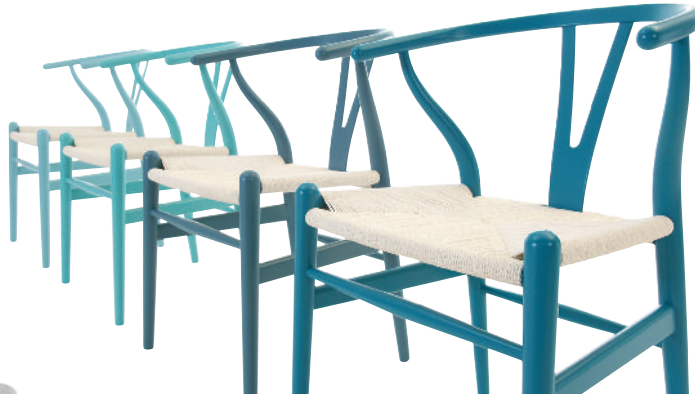
Hans J. Wegners Y-stole i blå Carl Hansen & Søn har doneret fire klassiske Y-stole, CH24, designet af Wegner i 1949. Stolen har været i produktion uafbrudt lige siden, og blev i anledning af sit 60-års-jubilæum lanceret i nye farver.