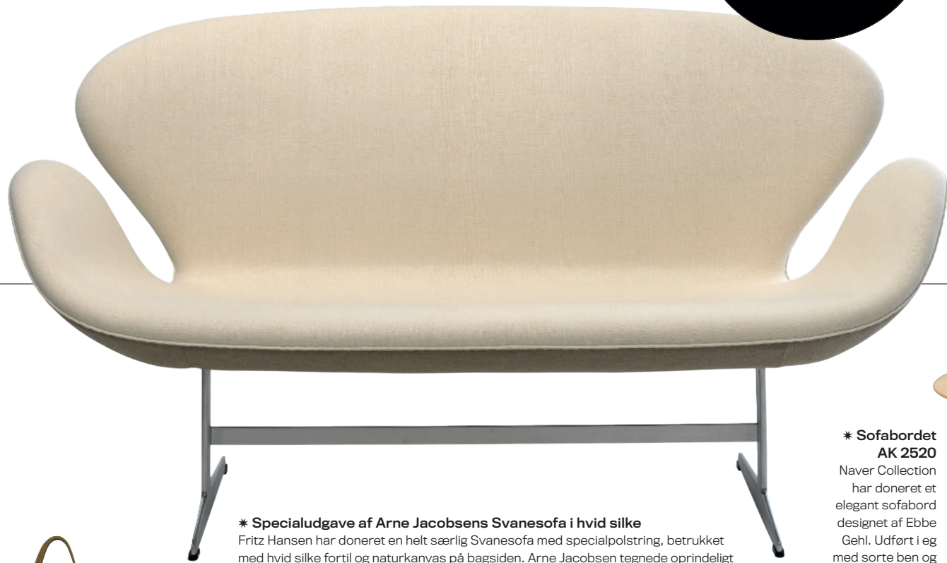
* Specialudgave af Arne Jacobsens Svanesofa i hvid silke Fritz Hansen har doneret en helt særlig Svanesofa med specialpolstring, betrukket med hvid silke fortil og naturkanvas på bagsiden. Arne Jacobsen tegnede oprindeligt sofaen til suiteerne, loungen og restauranten på SAS-hotellet i København i 1958. Svanesofaen var i produktion fra 1964-1974 og blev relanceret i 2000.

AUKTION BYD PÅ LAURITZ.COM ALT HER ER TIL SALG!