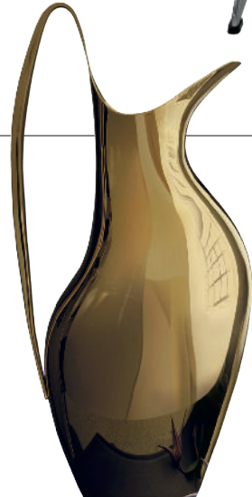
* Koppel-kande i guld Georg Jensen har doneret en specialudgave af Henning Koppels ikoniske kande i guld. Den blev oprindeligt designet i sølv i 1952, og er et smukt eksempel på Henning Koppels kærlighed til de organiske former.