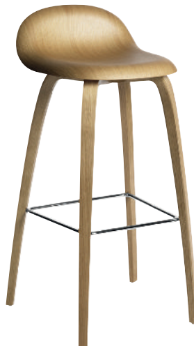
* Moderne barstole fra Gubi Gubi har doneret to barstole udført i egetræ. De høje stole har samme bløde formsprog som deres "far", den originale Gubi Chair fra 2003.