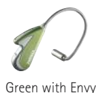
Green with Envy