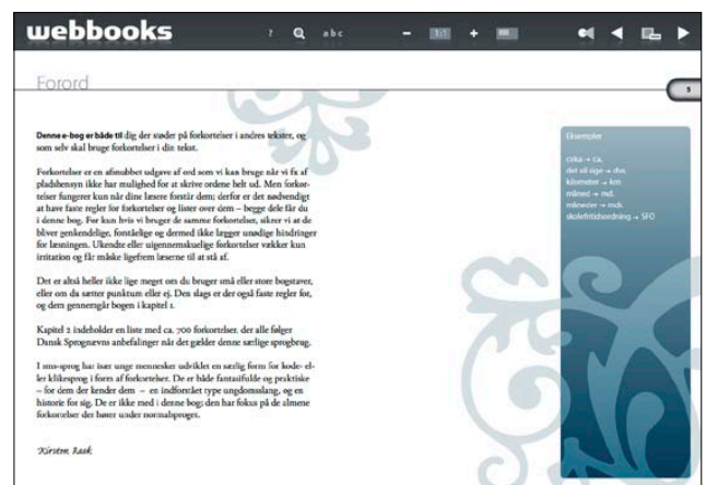
Forordet fra webbook'en