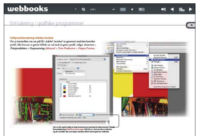
Fra kapitlet »Simulering i grafiske programmer«