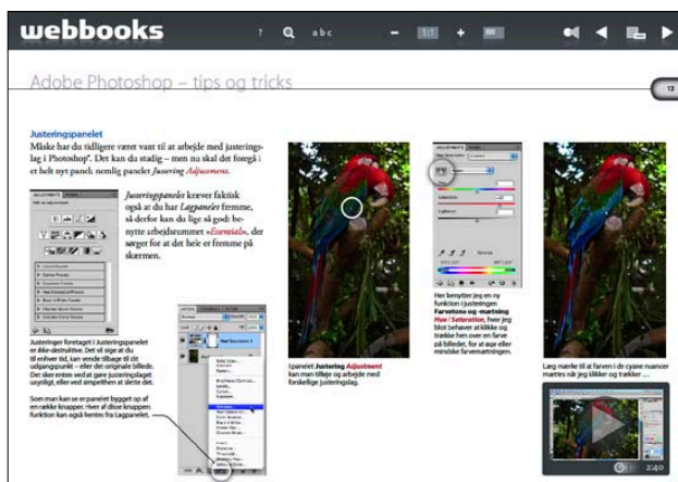
Det nye justeringspanel i Adobe Photoshop CS4