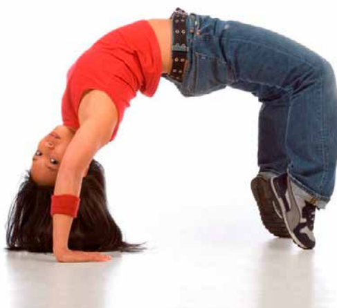
BROEN - bygger bro for udsatte børn