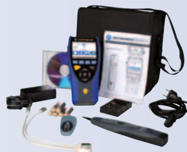
LanXPLOERER PRO - Premium kit