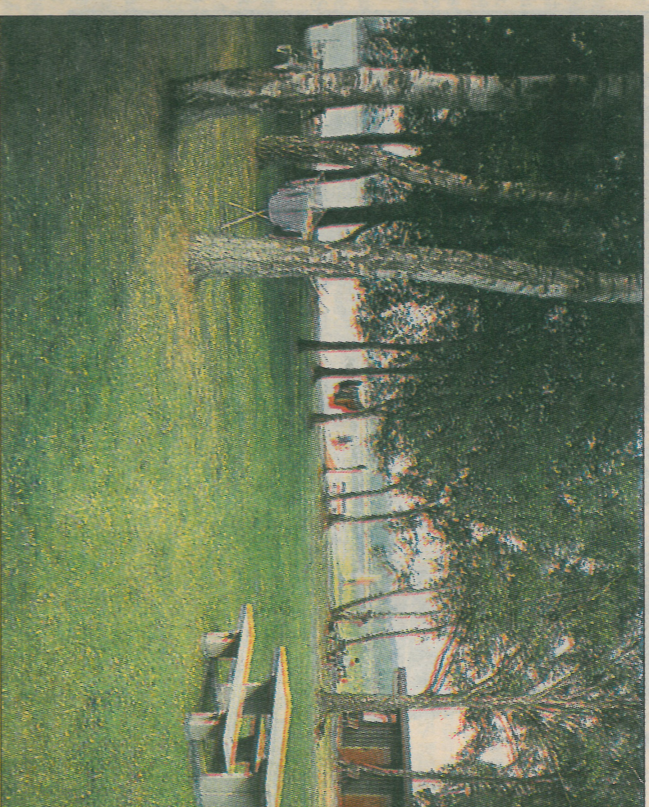
Vor udsendte lystfisker har masser af ros til overs for vandrehjemmet ved Skanderborg

Mellem deltagerne i år er bl.a. Jacob Haugaard, Povl Kjøller, Bob Geldof, Nils Lofgren, Kim Larsen, Gnager, Tars Lilholt, Sort Sol, The Roots, The Roots, Brian Auger & Triumphant, Angelique Kidjo,